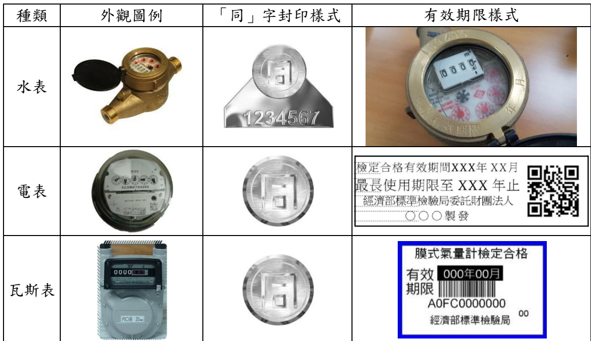
圖2 家用三表「同」字封印及有效期限的樣式

家用三表顯示的使用度數是否準確，直接影響到水費、電費及瓦斯費的計算是否正確，對民眾的權益及公用事業的正常營運影響非常重大。經濟部為確保家用三表計量準確，保障民眾權益並維持交易的公平，公告發布的《度量衡器檢定檢查辦法》中，已經將家用三表(水表、電表及瓦斯表)列為應實施檢定的法定度量衡器。也就是說，家用三表必須經過檢定合格才能掛表使用，民眾也能用得安心。經過檢定合格的家用三表，會附加專屬的「同」字封印及有效期限標示，以供民眾辨別。家用三表「同」字封印及有效期限標示的樣式如圖2。