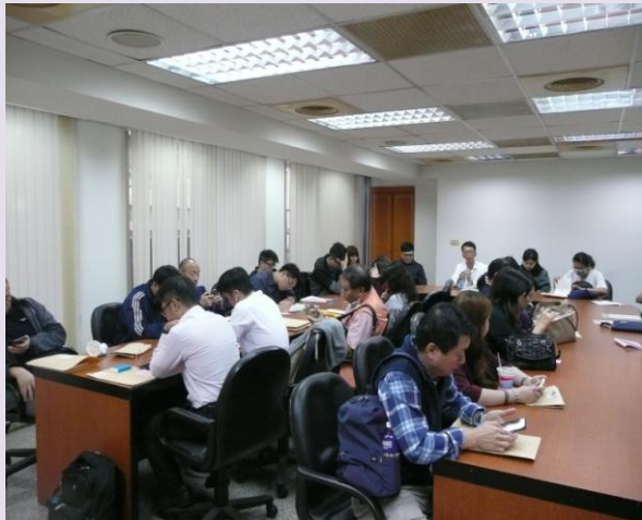
儀器展報名第一天廠商等候報名之一