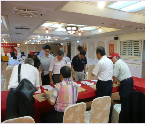
廠商協調會參展廠商報到之二