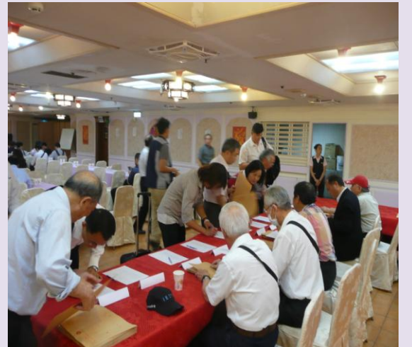
廠商協調會參展廠商報到之一