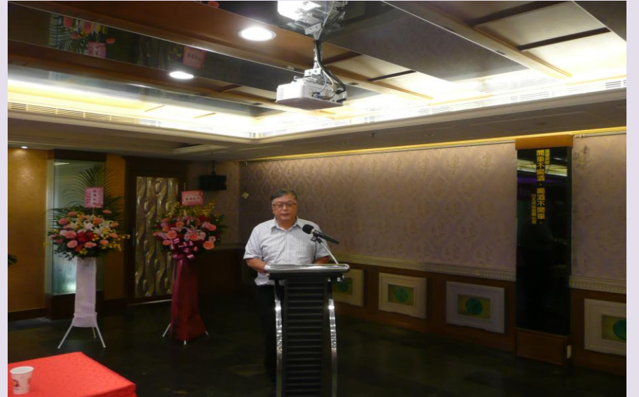
監事高化倫代表監事會報告監察意見

※小提醒：滑鼠移至電子報任一文字，再按滑鼠左鍵，即可連結網站瀏覽相關照片或訊息。