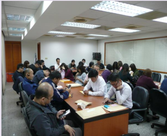
儀器展報名第一天廠商等候報名之二