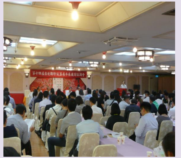
儀器展重要注意事項說明