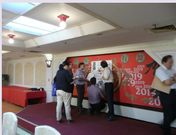
參展廠商選位之三