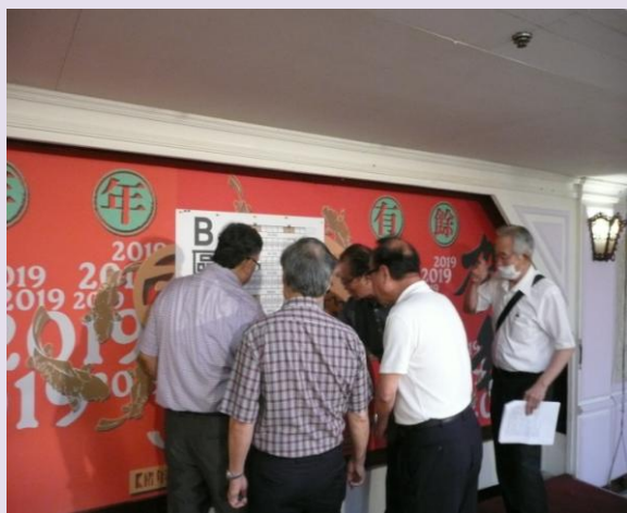
參展廠商選位之一