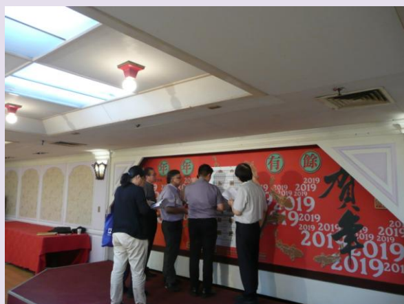
參展廠商選位之四