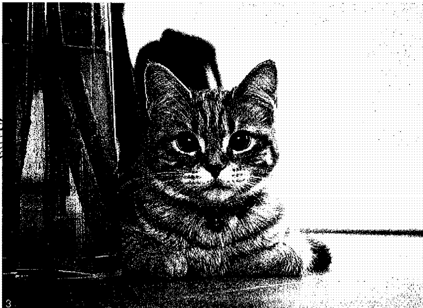
123 消費者使用 IP CAM 監控個人家居生活，除了即時照護家中長輩的安全，也兼顧獨自在家的寵物。

戴維余說明，非公務機關（如一般公司行號、商店）裝設監視器所得到的個人資料畫面原則上屬於《個人資料保護法》（下稱《個資法》