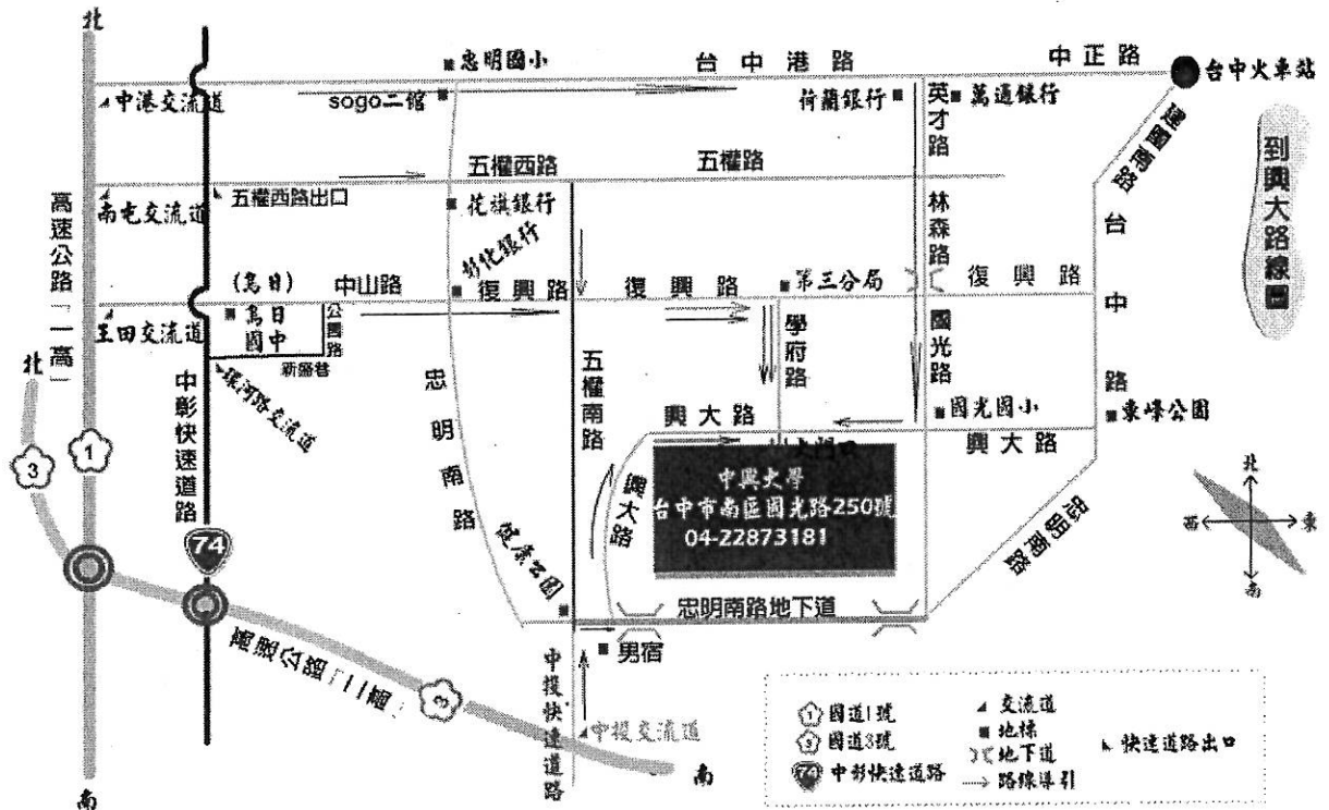
中興大學校園配置圖